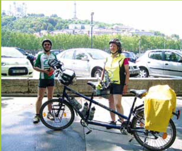
Zwischenstopp in Lyon

Plenzer 6, 67592 Flörsheim-Dalsheim, Tel. 0 62 43 56 49